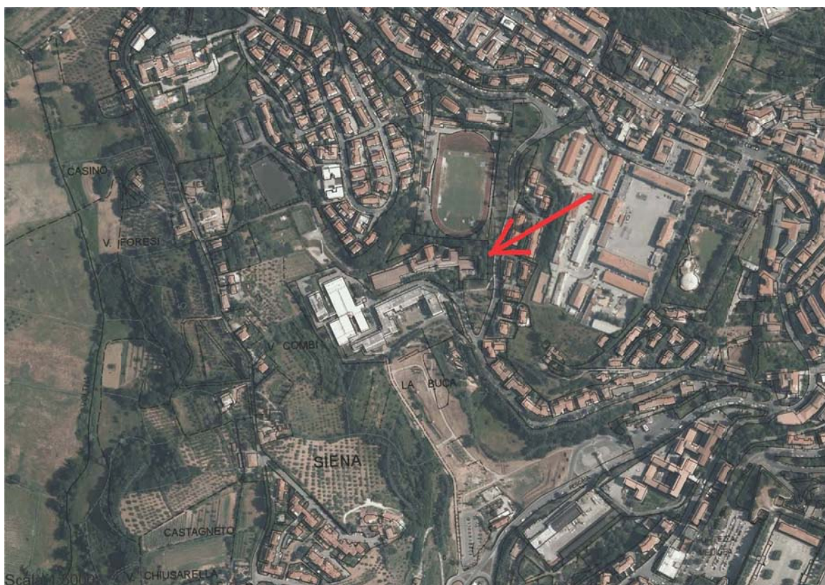
Localizzazione - ortofoto 1:5000